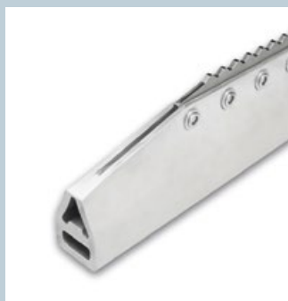
Steg / Cleats