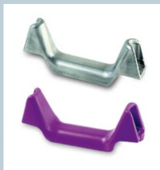
Spurbügel / Tireguide

© HANS HALL GmbH, 05/2019 Änderungen, Druckfehler und Irrtümer bleiben vorbehalten. Farbabweichungen in den Abbildungen von den Original-Produkten sind drucktechnisch bedingt. Changes, misprints and errors excepted. Color deviations are due to printing technology.